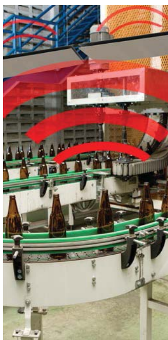
▲ Schematische Darstellung der Schallabsorption mit SonoPerf