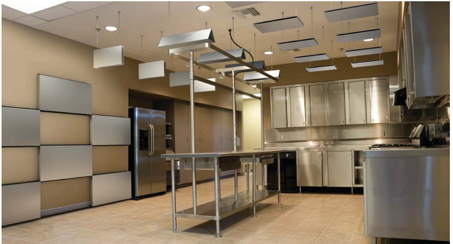
SonoPerf Serie 100