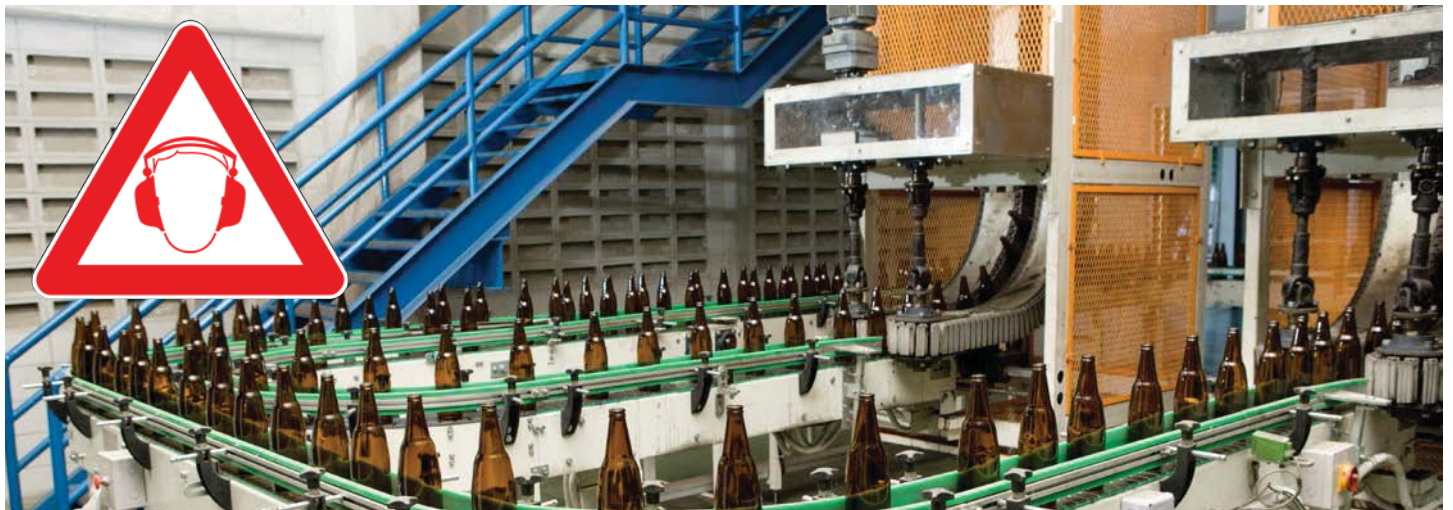
▲ Beispiel für ein lautes Arbeitsumfeld unter hygienischen Bedingungen