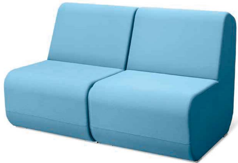
OPENPORT K2 ■