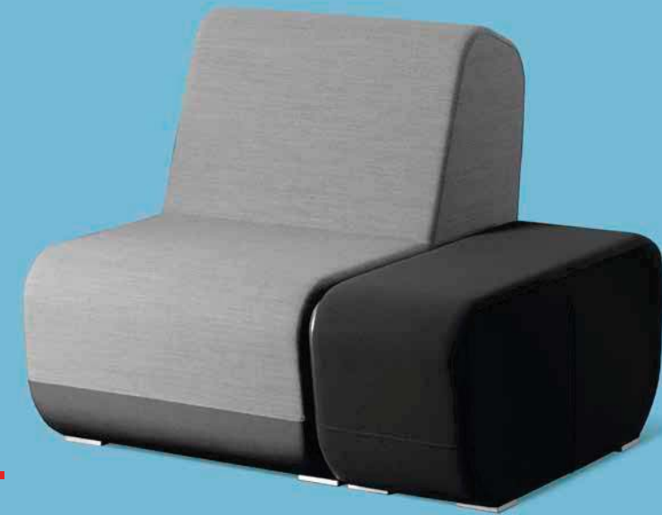
OPENPORT KL+KTR ■