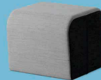
OPENPORT T ■