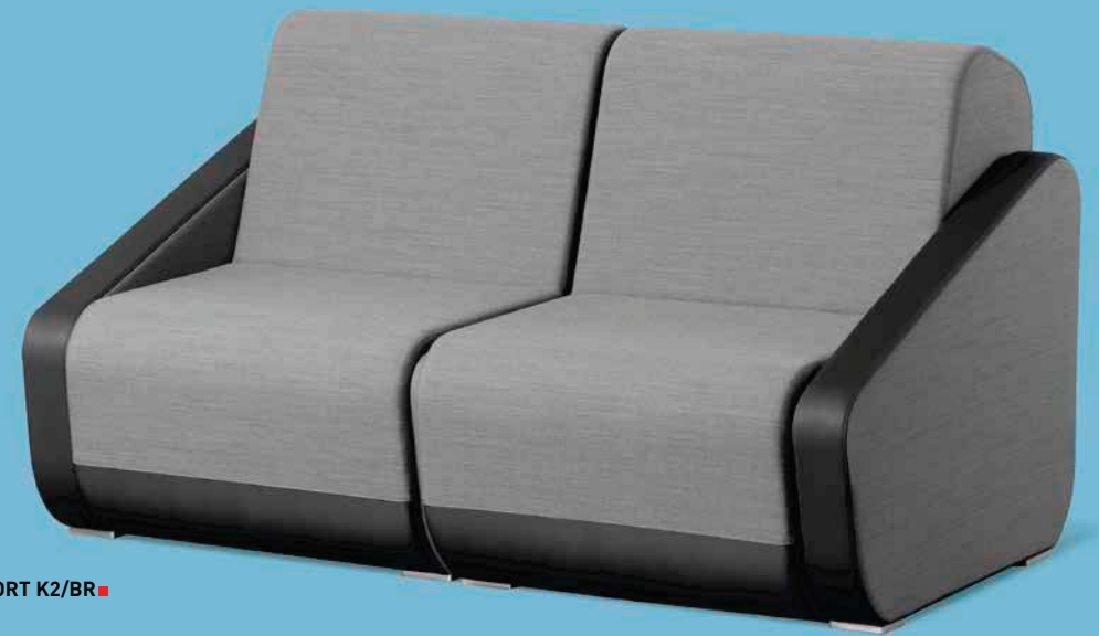
OPENPORT K2/BR ■