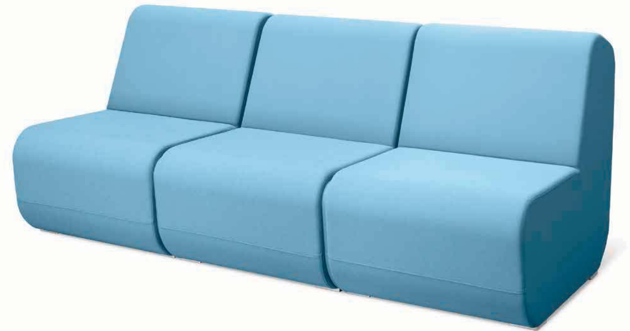
OPENPORT K3 ■

Open port offre aussi de nombreux détails pratiques. Le système est capable d'intégrer "les boîtes électriques," où on trouve des prises électriques pour alimenter des appareils de communication portables.