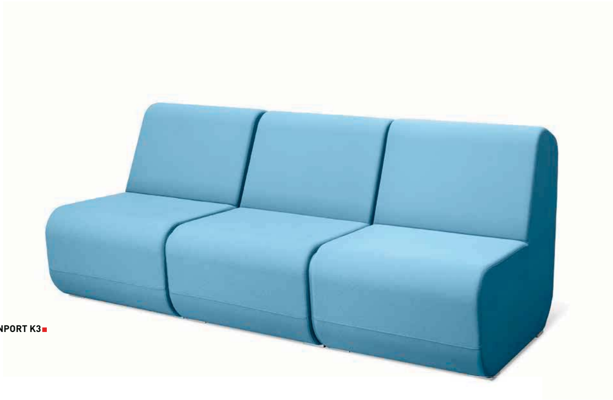
OPENPORT K3 ■