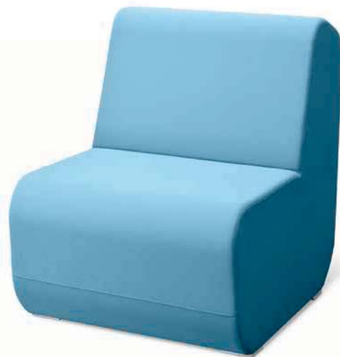
OPENPORT K ■