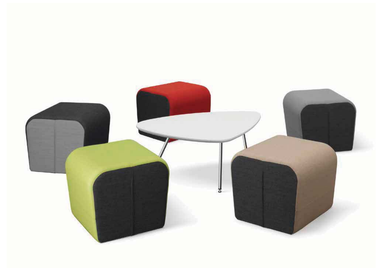
OPENPORT T ■